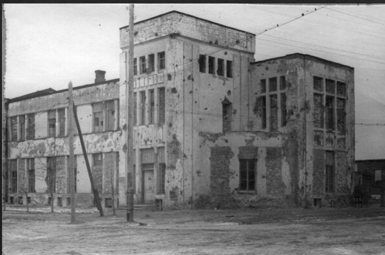
Вид разрушенных зданий на ул. Ленина в г. Сальске после освобождения от немецких оккупантов