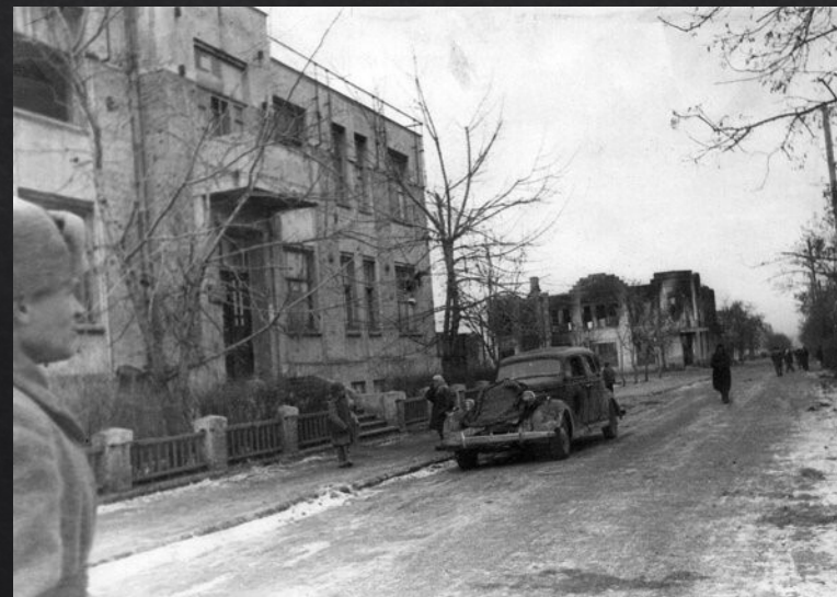
Улица Ленина в г. Сальске, освобожденная от немецких оккупантов