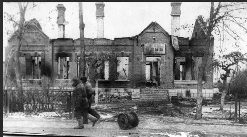
Разрушенный немецкими оккупантами Клуб железнодорожников в г. Сальске

. Цветущие и зажиточные села и хутора Сальского района были разграблены и превращены в развалины. Особенно злобно-нетерпимое отношение немецко-фашистские захватчики проявили к культурно-просветительным организациям. Ими были сожжены прекрасно оборудованный клуб в зерносовхозе Гигант со зрительным залом и кино на 600 человек, сожжена там же библиотека. Разграблен клуб в ВКЗ им. Буденного, сожжен и уничтожен клуб им. Ленина в г. Сальске со зрительным залом на 600 человек. Разорен и уничтожен Сальский стадион, имевший трибуну на 8000 человек со спортивными залами и полным оборудованием. Разрушен и сожжен со всеми надворными постройками и трибуной Сальский ипподром.