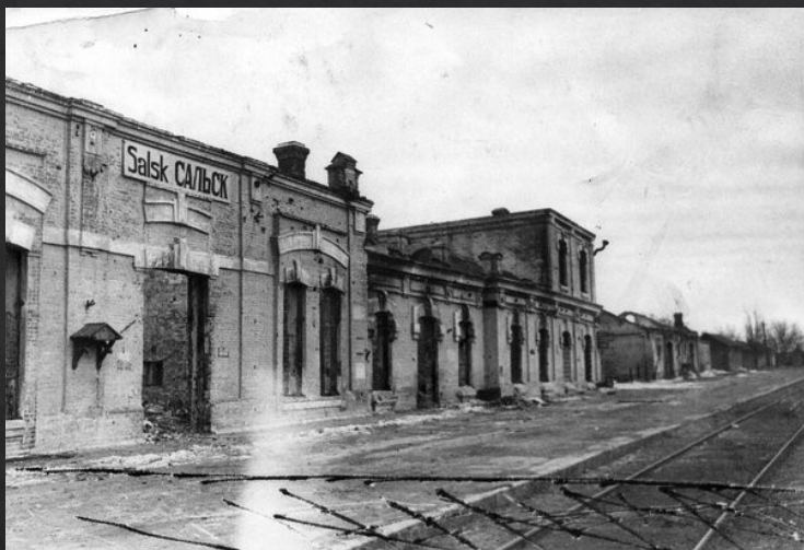
Разрушенное немецкими оккупантами здание железнодорожной станции Сальск